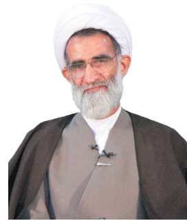
امام جمعه شهرکرد: مسئولان با رفع مشکلات مردم امید آفرینی کنند