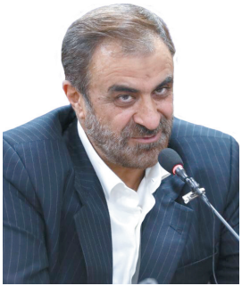
استاد چهارمحل و بختیاری: ۲ هزار و ۵۰۰ میلیارد ریال در سفر رئیس جمهور به چهارمحل و بختیاری برای امور فرهنگی مصوب شد