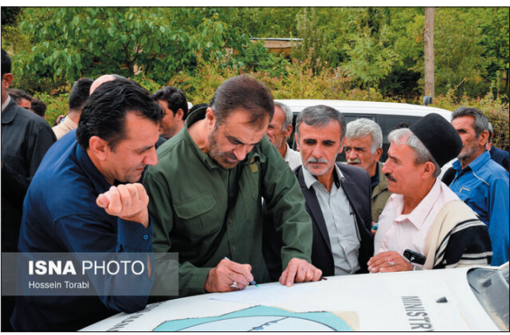
کوهرنگ تسریع و بخشی از پروژه‌ها قبل از آغاز سرما بهره‌برداری شود. وی با اشاره به اجرایی شدن طرح‌های فیبر نوری و خانه هلال در

حیدری تأکید کرد: با توجه به کوتاه بودن فصل کاری در چهارمحال و بختیاری تأکید شد تا روند اجرایی طرح‌های دهستان موگویی شهرستان