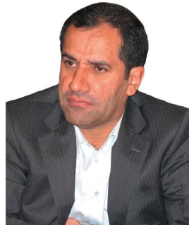
رئیس دانشکده علوم پزشکی شهید خدیجه ضرورت همراه شدن مشارکتهای اجتماعی در حوزه بهداشت و درمان