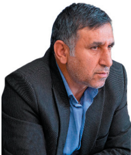
مدیرعامل شرکت آب و فاضلاب استان: تعویض شبکه آبرسانی یا هدف جلوگیری از هدر رفت آب در شهر سامان