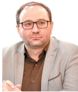
شهردار شهرکرد: افتتاح ۱۷ پروژه شهری در شهرکرد به مناسبت هفته دولت