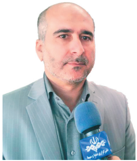
مدیرکل بیمه سلامت چهارمحال و بختیاری: بهره‌مندی ۳۳ هزار بیمار خاص چهارمحال و بختیاری از خدمات بیمه سلامت