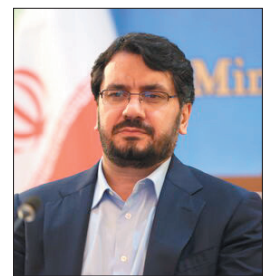
وزیر راه و شهرسازی اعلام کرد: یکصد هزار واحد مسکونی شهری و روستایی و بافت فرسوده در هفته دولت تحویل

مردم در سراسر کشور می‌شود. مهرداد بذرپاش در آستانه فرارسیدن هفته دولت ۱۴۰۲، در پیامی اعلام کرد: به لطف الهی یکصد هزار واحد مسکونی (شهری و روستایی و بافت فرسوده) در هفته دولت تحویل مردم شریف ایران خواهد شد. بنابر این گزارش واحدهای مسکونی شروع شده و در حال ساخت در قالب طرح نهضت ملی مسکن در دولت سیزدهم در مجموع یک میلیون و ۴۷۶