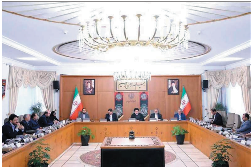
ارائه گزارشی از بازدید خود از معادن ذغال سنگ استان کرمان و نیز رونق و رشد کیفی و کمی تولید در صنایع مس، نظرات و درخواست‌های کارگران را به اطلاع اعضای جلسه رساند. سید صولت مرتضوی همچنین واردات بی‌رویه را موجب زیان دیدن کارخانجات کشور دانست.

رئیس جمهور تمرکز بر بهبود وضع معیشتی مردم از اولویت‌های اصلی مجموعه اقدامات و فعالیت‌های دولت دانست و بر ضرورت پرهیز از تعلل کارها به بهانه نظرات کارشناسی تأکید کرد. در جلسه دیروز هیئت دولت که به ریاست سید ابراهیم رئیسی برگزار شد، وزرا و اعضای کابینه با ارائه گزارش‌هایی به تشریح عملکرد و اقدامات صورت گرفته در حوزه کاری خود پرداختند. در این جلسه وزیر جهاد کشاورزی و رئیس سازمان برنامه و بودجه با تقدیر از اهتمام رئیس جمهور نسبت به پرداخت مطالبات گندمکاران از روند پیگیری پرداخت این مطالبات از جمله تخصیص اعتبار ۵۰ هزار میلیارد تومانی گزارشی ارائه کردند. وزیر نفت نیز از کورده‌شکنی حجم گازرسانی به نیروگاهها و خنثی‌سازی اثرات تحریم و همچنین افزایش تولید نفت خبر داد. مهندس اوجی در گزارش خود از اقدامات وزارت نفت برای مقابله با شایعه پراکنی و التهاب‌آفرینی درباره افزایش قیمت بنزین حضور دکتر منبخر در جایگاه‌های بنزین را موجب آرامش افکار عمومی و کاهش التهاب ناشی از شایعات مطرح شده عنوان کرد. وزیر تعاون، کار و رفاه اجتماعی هم ضمن