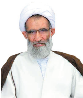
امام جمعه شهرکرد: حرکت دولت سیزدهم بر مبنای کار جهادی است