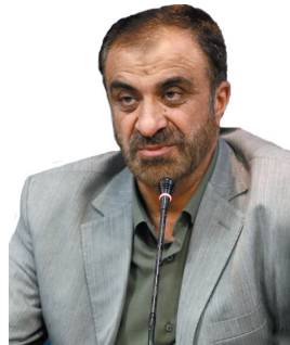
استاندار چهارمحال و بختیاری: رونود بهر بهر مدارای و کلنگزنی از ۹۵۰ طرح در استان آغاز شد