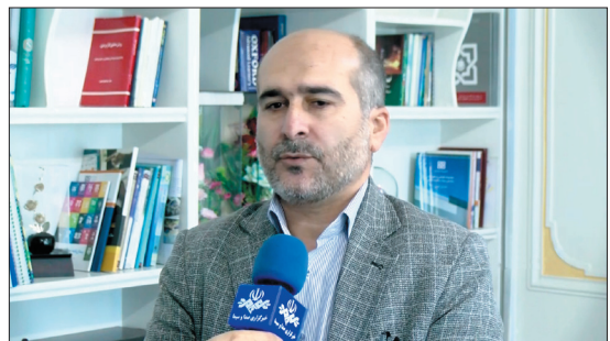
بازرسان سازمان بیمه سلامت ایران اقدامات و عملکرد اداره کل بیمه سلامت چهارمحال و بختیاری را در ارائه خدمات به بیمه شدگان در