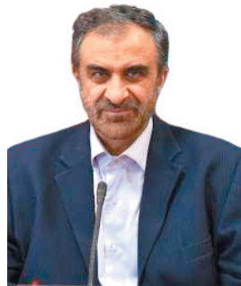
استاندار چهارمحال و بختیاری: مدیران در چارچوب قانون مدیریت تحولی داشته باشند