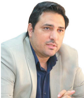
رئیس سازمان جهاد کشاورزی چهارمحال و بختیاری تکمیل طرح‌های توسعه باغات چهارمحال و بختیاری ۲۰ هزار میلیارد ریال نیاز دارد