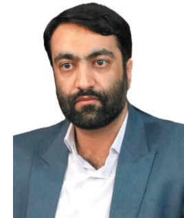
مدیرکل فرهنگ و ارشاد اسلامی چهارمحال و بختیاری، احداث مجتمع فرابزر آبی چهارمحال و بختیاری آغاز شد