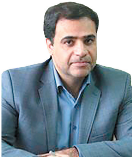
مدیرعامل شرکت توزیع نیروی برق استان، ۱۰۰ میلیارد تومان اعتبار در حوزه برق‌رسانی شهرستان فلارد سرمایه‌گذاری شد