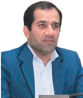
رئیس دانشگاه علوم پزشکی شهرداری ورود ۱۰۰۰ میلیارد تومان تجهیزات پزشکی سنگین سرمایه‌ای به چهارمحال و بختیاری