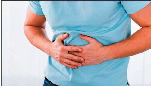
دانشی های سلامت

یک کارشناس طب سنتی با اشاره به اهمیت تغذیه صحیح در برطرف کردن نفخ معده گفت: در بین افراد بالغ بالاتر از ۳۰ سال حدود ۳۰ درصد عارضه نفخ معده مشاهده می‌شود.