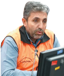
مدیرکل راهداری و حمل و نقل جاده‌های استان، مسافران ناپستایی بازگشت خود را به روزهای پایانی شهریور موکول نکنند