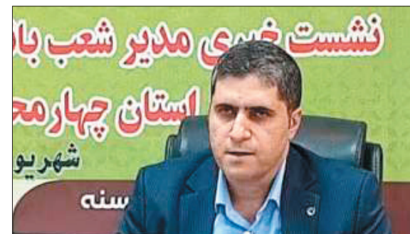
نشست خبری مدیر شعب بانک قرض الحسنه مهر ایران چهارمحال و بختیاری

به افزایش میزان تولید و فروش تولیدکنندگان و فروشندگان کالا و خدمات ایرانی و کمک به افزایش قدرت خرید مشتریان با استفاده از پرداخت اقساطی بهای کالا به جای خرید نقد است.