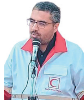
مدیرعامل جمعیت ملال احمد استان، امدادگران هلال احمر چهارمحال و بختیاری در ۲۰ حادثه امداد رسانی کردند