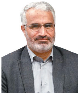
معاون استاندار چهارمحال و بختیاری اعلام کرد نتیجه صحت‌سنجی مدارک داوطلبان مجلس شورای اسلامی به آنها اعلام می‌شود