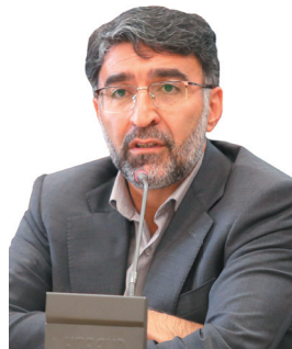
مدیرکل آموزش و پرورش چهارمحال و بختیاری؛ برگزاری جشن شکوفه‌ها با شرکت ۲۰ هزار دانش آموز کلاس اولی در چهارمحال و بختیاری