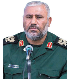
فرمانده سپاه قهر بنی‌هاشم (ع) چهارمحال و بختیاری: ۱۳ هزار میلیارد ریال کمک موانده در چهارمحال و بختیاری جمع آوری و توزیع شد