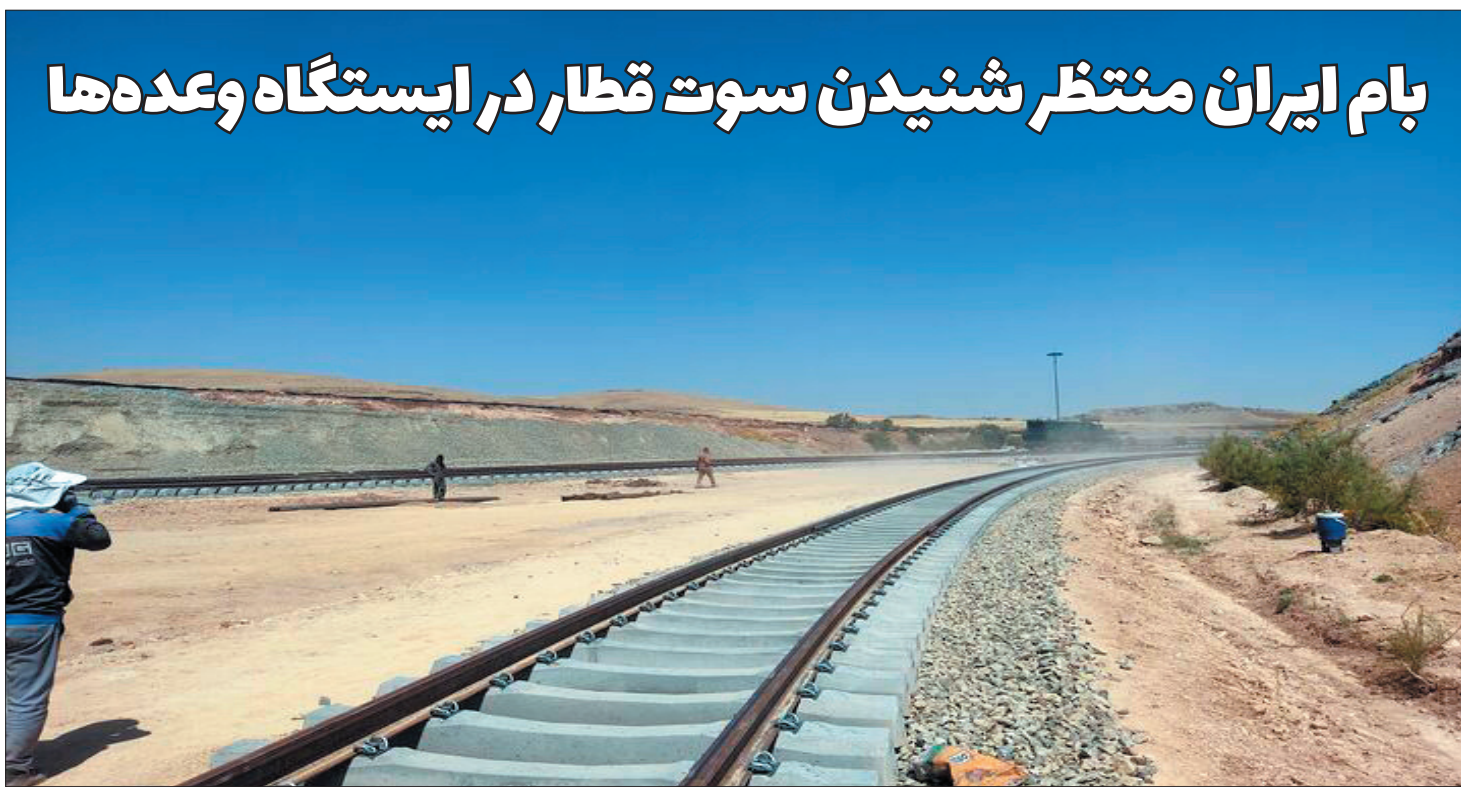
بام ایران منتظر شنیدن سوت قطار در ایستگاه وعده‌ها

سرپرست معاونت بازرسی و نظارت صمت چهارمحال و بختیاری گفت: از مردم درخواست می‌شود در صورت مشاهده تخلفی در واحدهای صنعتی با سامانه ۱۲۴ تماس بگیرند و موارد را اطلاع بدهند.