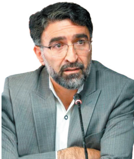
مدیرکل آموزش و پرورش چهارمحال و بختیاری: اجرای پروژه زیباسازی و شادابسازی مدارس در چهارمحال و بختیاری