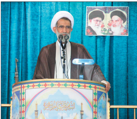
در همین خصوص آموزش و پرورش رسالت سنگینی بر عهده دارد. امام جمعه شهر کرد با تسلیت شهدات امام حسن عسکری (ع) در هشتم ربیع الاول و بزرگداشت شهدای مینا، بیان داشت: باید حق شهدای ما بدرستی ادا شود.

انواع خلاقیت‌ها و ابتکارات به میدان آمد اما همه این موارد در سایه تعهد، ایمان و تقوا محقق شد. وی یادآور شد: ادامه راه دفاع مقدس نیازمند ایمان و اخلاص است و اگر چه انقلاب اسلامی مسیر خود را با سرعت می‌پیماید و به قله نزدیک می‌شود اما ما باید خود را در این مسیر جای دهیم و از قافله بازمانیم. نونام همچنین به در پیش بودن هفته وحدت اشاره کرد و گفت: وحدت از مسائل مهم جهان اسلام است و باید تا می‌توان در این راستا تلاش کرد. وی همچنین با تبریک آغاز سال تحصیلی جدید، نسل جوان و نوجوان را نیازمند مربیان متعهد و هادینگر دانست و اظهار داشت: نباید اجازه دهیم که نسل جوان فریب دشمن را بخورد و آب و آّب به آسیاب دشمن بریزد که