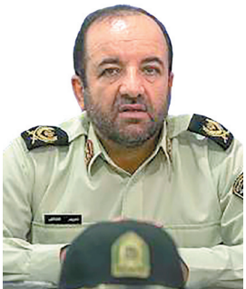
فرمانده انتظامی چهارمحال و بختیاری کشف محموله قاچاق ۳۱ میلیاردی در چهارمحال و بختیاری