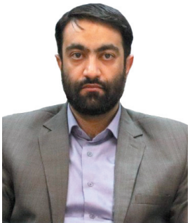
مدیرکل فرهنگ و ارشاد اسلامی چهارمحال و بختیاری، برگزار می‌کند و یکمین جشنواره بین‌المللی هنرهای نمایشی، آئینی و سنتی در چهارمحال و بختیاری