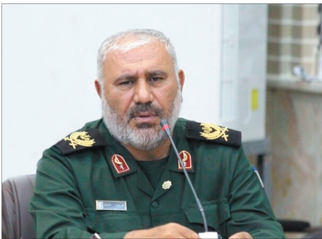
فرمانده سپاه قمر بنی‌هاشم (ع) چهارمحال و بختیاری: