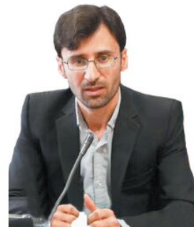
مدیرکل تعاون، کار و رفاه اجتماعی چهارمحال و بختیاری، سه هزار و ۷۰۰ بازرسی از کارگاه‌های مشمول قانون کار چهارمحال و بختیاری انجام شد