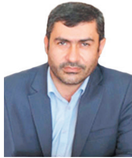
مدیرکل دامپزشکی چهارمحال و بختیاری: نغم ماسی فزل آلا برای نخستین بار از چهارمحال و بختیاری صادر شد