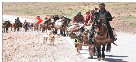
رئیس امور عشایر کوهرنگ با اشاره به آغاز کوچ پاییزه عشایر

ادامه داد: عشایر چهارمحال و بختیاری در این کوچ با گذراندن بیش از یک هزار کیلومتر از ایل راه‌های بازفت، هزارچم، چلو و شیمبار، دزپارت، تراز و کوه سفید به مناطق گرمسیری می‌روند. وی با اشاره به اینکه خانوارهای عشایری یک دوره هفت ماهه را در مناطق قشلاقی سپری می‌کنند، افزود: عشایر چهارمحال و بختیاری دارای پنج طایفه بزرگ، ۲۴ زیرطایفه، ۳۲ تیره و ۲ هزار و ۹۴۰ تش هستند.