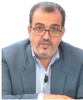
مدیرکل منابع طبیعی و آبفشاری چهارمحال و بختیاری: اجرای ۴ هزار سازه آبفشاری در چهارمحال و بختیاری