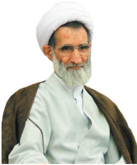
نماینده ولیفقیه در چهارمحال و بختیاری امروز آفکار عمومی جهان علیه اقدامات ددمشانه اسرائیل است