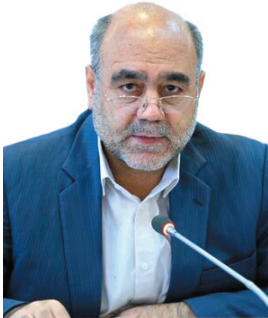
رئیس کل دادگستری چهارمحال و بختیاری دفاتر خدمات الکترونیک قضایی مونتزی در ترویج صلح و سازش دارند