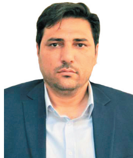
رئیس سازمان چهارمحال و بختیاری عشایر چهارمحال و بختیاری سهمیه ۵۰ هزار راسی از طرح تولید فرارادی گوشت فریز دارند