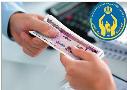
و ودیعه مسکن به مددجویان اضافه کرد: در طی این مدت، ۳ میلیارد و ۳۸۱ میلیون تسهیلات در راستای تأمین مسکن مناسب به ۱۱۲ مددجو پرداخت شده است.

وی با اشاره به پرداخت تسهیلات احداث، تعمیر