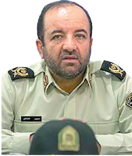
فرمانده انتظامی چهارمحال و بختیاری دستگیری اخلال گران اقتصادی در چهارمحال و بختیاری