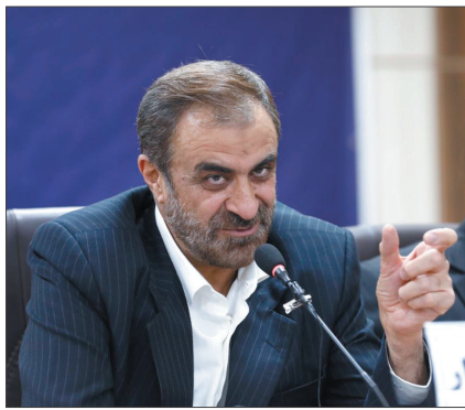
بازارچه‌های سیار را با هدف کمک به کاهش قیمت‌ها راه‌اندازی کنیم.

وی یادآور شد: اگر شهرداری‌ها زمین در اختیار سازمان همیاری و شهرداری‌های استان دهند حاضریم