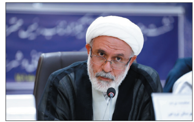
نماینده مردم شهرستان بروجن در مجلس شورای اسلامی گفت: مهم‌ترین هدف از ایجاد سازمان ملی سنجش و ارزشیابی تحقق عدالت آموزشی به‌عنوان یکی از شعارهای دولت سیزدهم است که همه باید زمینه اجرایی شدن این شعار را فراهم کنند.

به گفته نماینده مردم شهرستان بروجن در مجلس شورای اسلامی هرچند نظارت‌پذیری بیشتر مجموعه‌هایی که از دایره وزارتخانه‌ها خارج می‌شوند کمتر می‌شود و مجلس نمی‌تواند به روی آن نظارتی داشته باشد با این وجود باید مصوبه‌ای که از سوی شورای عالی انقلاب فرهنگی در خصوص تشکیل سازمان ملی سنجش و ارزشیابی صادر و رئیس‌جمهور آن را ابلاغ کرده به طور کامل عملیاتی شود.