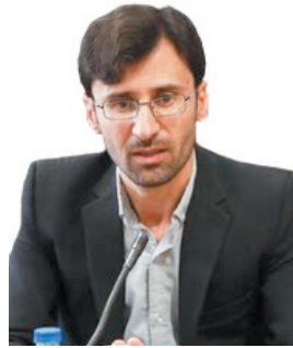
مدیرکل تعاون، کار و رفاه اجتماعی چهارمحال و بختیاری صدر پیش از ۲۵۰۰ مجوز مشاغل خانگی در چهارمحال و بختیاری