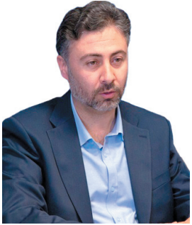
مدیرکل صنعت، معدن و تجارت چهارمحال و بختیاری: اجرای طرح دهکده فرش چهارمحال و بختیاری در انتظار تخصیص زمین است