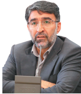
مدیرکل آموزش و پرورش چهارمحال و بختیاری: کمیود معلم در مدارس چهارمحال و بختیاری بر طرف شد