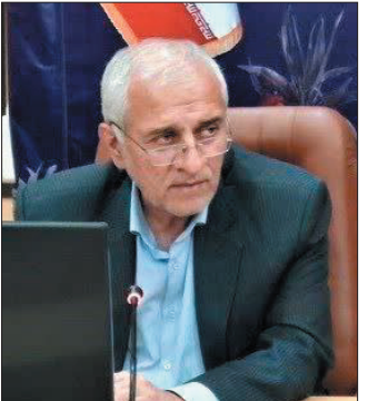
مورد از سایت‌های چهارمحال و بختیاری به G و ۳G وصل شده‌اند.