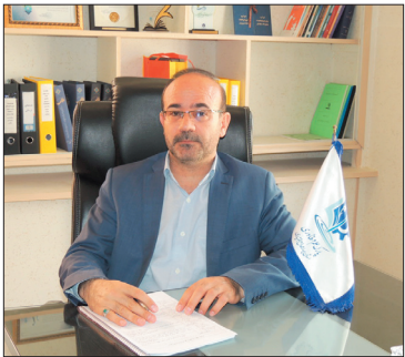
پیش‌رشد حدود ۲۱۰ شرکت می‌شوند.