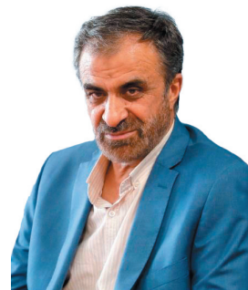
استاد: چهار محال و بختیاری به کارگاه عمرانی تبدیل شده است