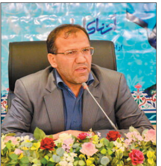
وی در پایان خاطر نشان کرد: ۳۹۷ مورد از سایت‌های چهارمحال و بختیاری به G و ۳G وصل شده‌اند.