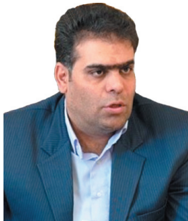
مدیرکل کمیته امداد امام خمینی (ره) چهارمحال و بختیاری واگذاری ۱۸۶ واحد مسکن به مددجویان کمیته امداد چهارمحال و بختیاری