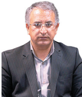
مدیرکل راه و شهرسازی چهارمحال و بختیاری، ۴۰ کیلومتر بزرگراه در چهارمحال و بختیاری آماده بهره‌برداری است