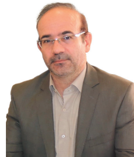
رئیس پارک علم و فناوری چهارمحال و بختیاری، ۳۵۰ میلیارد ریال از اعتبارات علمی سفر رئیس‌جمهور به چهارمحال و بختیاری محقق شد