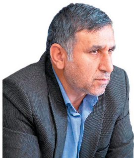
مدیرعامل شرکت آب و فاضلاب چهارمحال و بختیاری، تصفیه‌خانه فاضلاب فرادینه همزمان با سفر رییس جمهور به چهارمحال و بختیاری افتتاح می‌شود