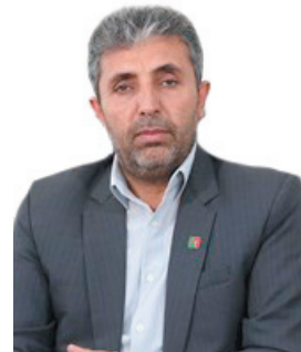
مدیرکل راهداری و حمل و نقل جاده‌های چهارمحال و بختیاری، افتتاح و آغاز عملیات اجرایی ۲۵۳ پروژه راه در چهارمحال و بختیاری