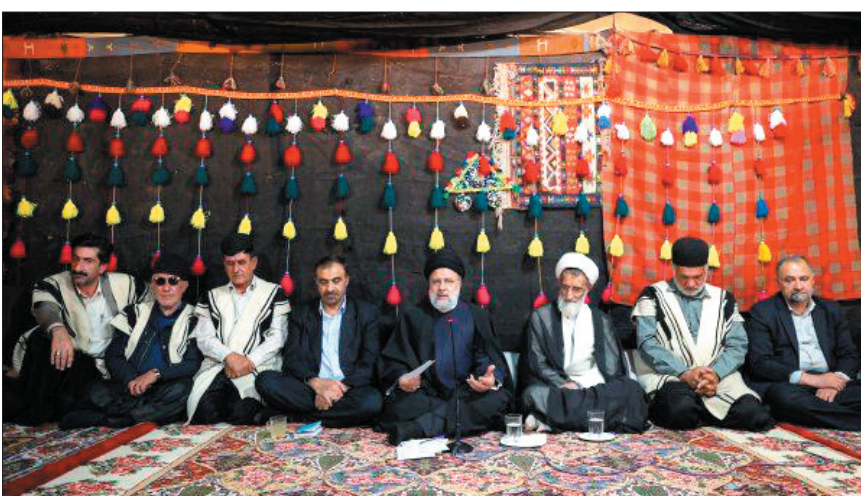
عشایر اختصاص پیدا کرده است اما مورد کاربری‌های دیگری قرار گرفته است، ایجاد همراستا برای

رئیس جمهور با تمجید از ایستادگی همیشگی عشایر در طول تاریخ در مقابل ظلم و نیز حضور درخشان آنها در عرصه‌های پاسداری از انقلاب و دوران دفاع مقدس بر حفظ هویت فرهنگی و ملی عشایر تاکید کرد. به گزارش پایگاه اطلاع‌رسانی دولت، آیت‌الله سید ابراهیم رئیسی عصر پنجشنبه در دیدار با جمعی از سران و نمایندگان عشایر استان با اشاره به اهتمام دولت برای رسیدگی به مشکلات و رفع نیازهای عشایر کشور، افزود: عشایر به لحاظ نقش آفرینی همه اعضای خانواده در فرآیند تولید، مولدترین بخش از جمعیت کشور هستند.