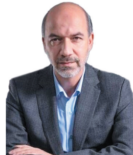
وزیر نیرو: آب پایدار تمام مناطق چهارمحال و بختیاری تا پایان دولت سیزدهم تامین می‌شود