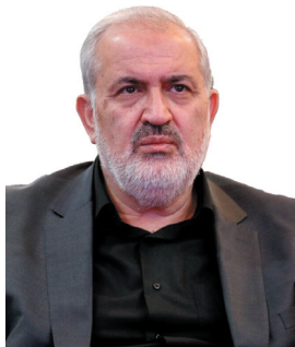
وزیر صمت: اصناف در قالب بازارچه‌های تخصصی ساماندهی می‌شوند