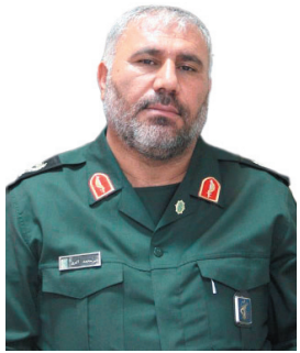
فرمانده سپاه حضرت قمر بنی‌هاشم (ع) چهارمحال و بختیاری دانشمندان بسیجی مسوره نوحه دشمن هستند