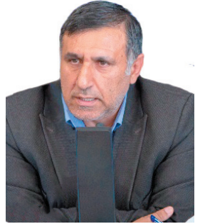
مدیرعامل شرکت آب و فاضلاب چهارمحال و بختیاری: ساخت مخزن ذخیره آب شرب در روسای خوی ۶۰ درصد پیشرفت فیزیکی دارد