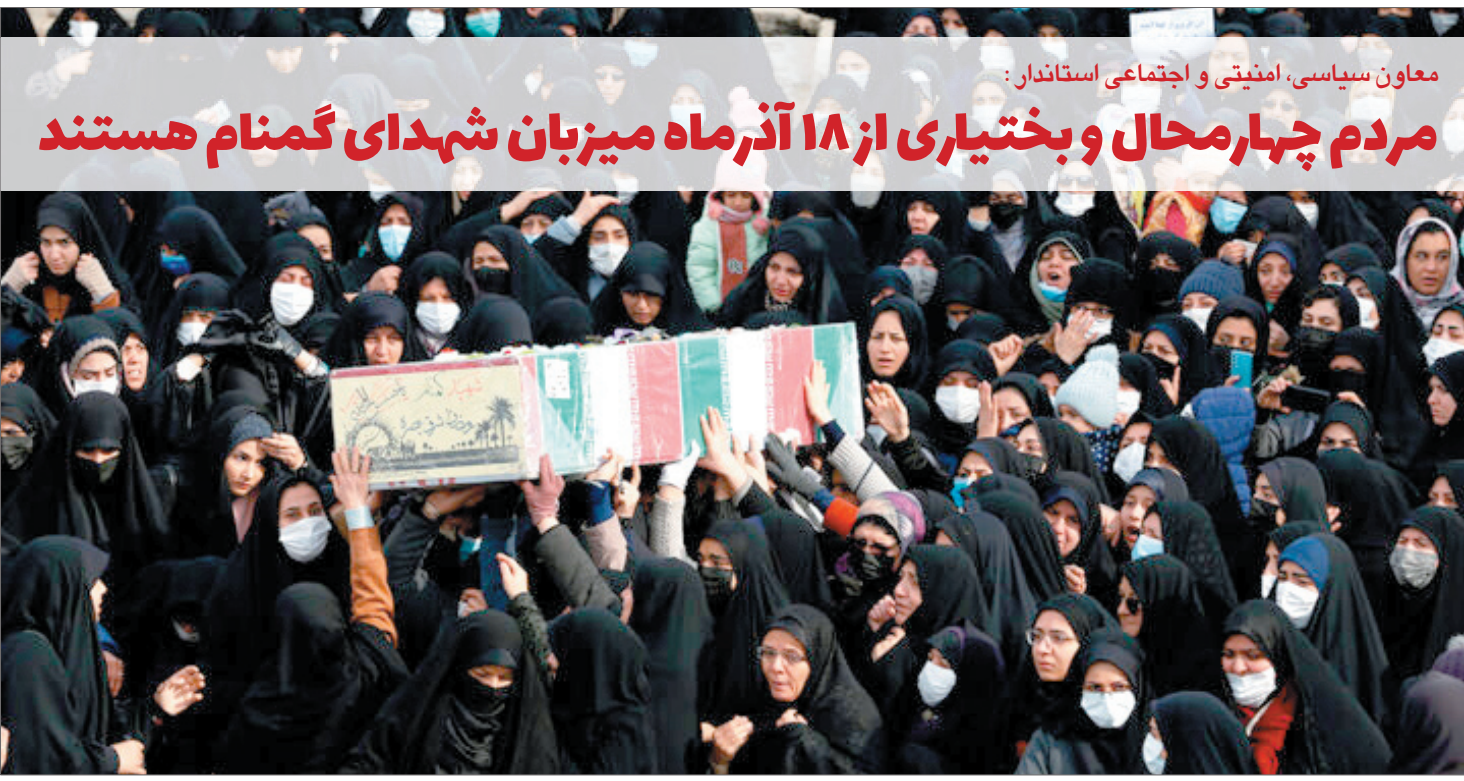
معاون سیاسی، امنیتی و اجتماعی استاندار: مردم چهارمحال و بختیاری از ۱۸ آذرماه میزبان شهدای گمنام هستند

محدودیت منابع آب، خشکسالی، تخصیص نایافتن اعتبارات لازم، قیمت پایین آب‌بها و فرسودگی شبکه‌های آبرسانی از مهم‌ترین چالش‌های آبرسانی در چهارمحال و بختیاری به‌شمار می‌رود. چهارمحال و بختیاری ۱۲ شهرسان با بیش از یک میلیون نفر جمعیت دارد.