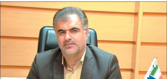
مدیر شرکت ملی پخش فرآورده های نفتی منطقه چهارمحال و بختیاری