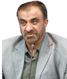
استاد چهارمحل و بختیاری استقبال از شهدای گمنام وحدت مردم ایران را به منصف ظهور می‌رساند