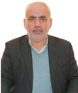
سرپرست اداره کل راه و شهرسازی چهارمحل و بختیاری ۱۹ هزار متقاضی نهضت ملی مسکن در چهارمحل و بختیاری مبلغ اولیه را پرداخت کردند