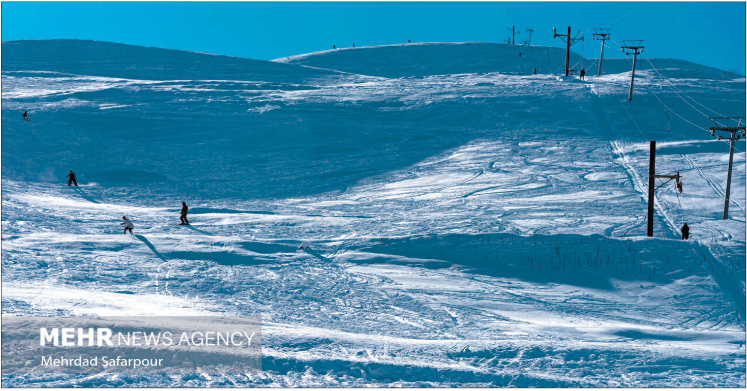
MEHR NEWS AGENCY Mehrdad Safarpour