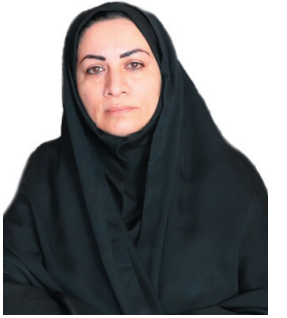
سرپرست اداره کل مزیستی چهارمحال و بختیاری: بهرمندی ۲۸۳ بانوی سرپرست خانوار از تسهیلات استفازای بزیستی چهارمحال و بختیاری