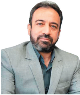
مدیرکل بیدار مسکن انقلاب اسلامی چهارمحال و بختیاری: بهبودی ۱۳۴ واحد مسکن روستایی در شهرستان ین در دستور کار است