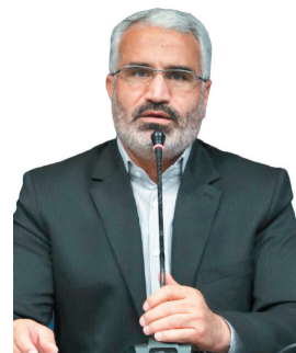
معاون سیاسی، امنیتی و اجتماعی استاندار، طرح یاریگران زندگی در ۲۶۰ روستای چهارمحال و بختیاری اجرا می‌شود