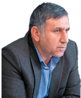
مدیرعامل آبنمای چهارمحال و بختیاری خیرباد، افزایش ذخیره سازی آب آشامیدنی شهر کرد تا ۵ میلیون لیتر