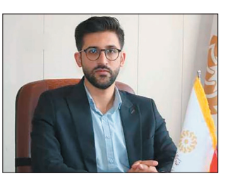
می‌توانند برای کسب اطلاعات بیشتر و شرکت در مسابقه سامانه مسابقات الکترونیکی نهاد کتابخانه‌های عمومی کشور به آدرس www.samakplir و کتابخانه‌های عمومی چهارمحال و بختیاری مراجعه کنند.

نماینده مردم شهرستان‌های شهرکرد، بن، سامان و فرخ‌شهر در مجلس شورای اسلامی از ایجاد اولین دهکده ورزش دانش‌آموزی آموزش و پرورش در راستای تکمیل زیرساخت‌ها و توسعه ورزش کشور در چهارمحال و بختیاری خبر داد. احمد راستپه نماینده مردم شهرستان‌های شهرکرد، بن، سامان و فرخ‌شهر در مجلس شورای اسلامی در نشستی با صادق ستاری‌فرد معاون تربیت‌بدنی وزارت آموزش و پرورش تصمیمات مهمی در خصوص تکمیل پروژه‌های ورزشی و زیرساخت‌های ورزش دانش‌آموزی چهارمحال و بختیاری اخذ کردند. در این نشست صادق ستاری‌فرد معاون تربیت‌بدنی وزارت آموزش و پرورش در خصوص اختصاص ۲۷ صدم درصد از ۹ درصد مالیات بر ارزش افزوده برای تقویت ورزش کشور و ورزش دانش‌آموزی و حمایت‌های لازم برای تسریع در تکمیل پروژه‌های ورزش دانش‌آموزی گزارشی ارائه کرد. احمد راستپه رئیس کمیته ورزش مجلس که مسئولیت کمیته ورزش برنامه هفتم توسعه را نیز بر عهده دارد با اشاره بر اینکه مصوبه تکمیل سالن‌های ورزشی و زمین‌های چمن مصنوعی باید مورد توجه ویژه قرار گیرد، گفت: در این جلسه ایجاد اولین دهکده ورزش دانش‌آموزی آموزش و پرورش در راستای تکمیل زیرساخت‌ها و توسعه ورزش کشور در استان چهارمحال و بختیاری مصوب شد.