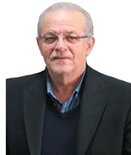
مدیرعامل شرکت آب منطقه‌ای چهارمحال و بختیاری تأمین نیاز آبی گلخانه‌ها و دامداری‌های شهرستان بن