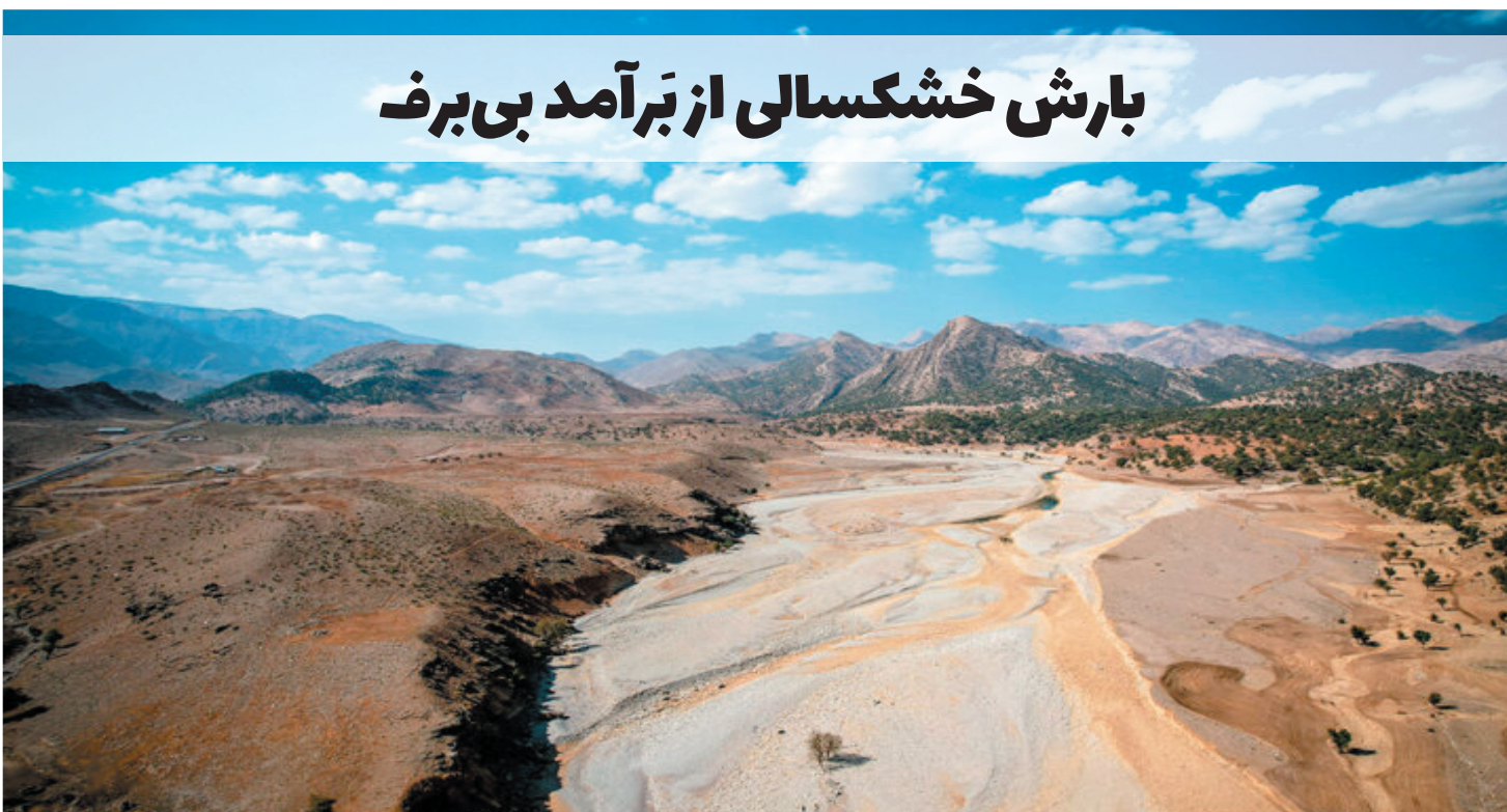
بارش خشکسالی از برآمد بی برف