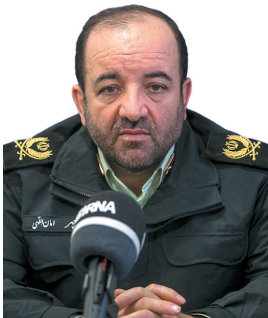
فرمانده انتظامی چهارمحال و بختیاری کشف بیش از ۴۲۹ هزار نخ سیگار قاچاق در محور لردگان - بروجن