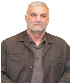
مدیرعامل شرکت گاز چهارمحال و بختیاری: اجرای بیش از ۱۶۰ کیلومتر شبکه گازرسانی در چهارمحال و بختیاری