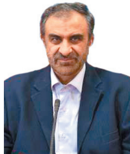
استاد چهارمحال و بختیاری: حساب بانکی شرکت‌های خصوصی باید در استان فعال شود