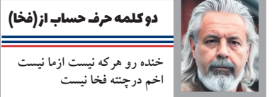
دو کلمه حرف حساب از (فخ)

خنده و هر که نیست از ما نیست اخم در چهره فخر نیست