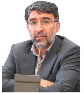
مدیرکل آموزش و پرورش چهارمحال و بختیاری: پویش انتخاباتی رای اولی‌ها در چهارمحال و بختیاری آغاز شد