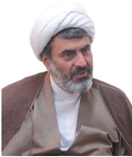
مدیرکل تبلیغات اسلامی چهارمحال و بختیاری: ۱۱۹ مسجد چهارمحال و بختیاری میزبانی از معتکفین شد