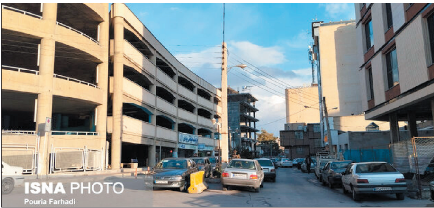
ISNA PHOTO Pouria Farhadi