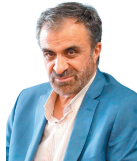
استاندار چهارمحال و بختیاری: انتخابات مهم‌ترین راهبرد نظام و دولت است