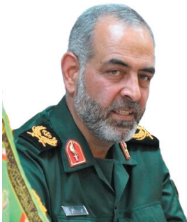
جانشین فرماندهی سپاه حضرت قمر بنی هاشم (ع) مشارکت مردم در انتخابات توپنه‌های دشمنان را خنثی می‌کند