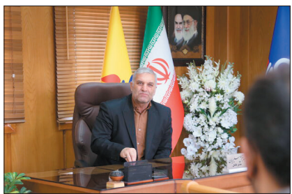
۵۱ مورد در سطح روستاها نصب شده است.

* پرویز کیانی شناگر برجسته گلستانی در ۱۶ آذر ۱۳۱۴ در محله باغ پلنگ گرگان متولد شد. وی از ۵ سالگی شیفته آب و شنا شد و در دوران ورزشی اش از شرق تا غرب دریای خزر در محدوده کشور ایران را با شنا به صورت رفت و برگشت در چندین روز طی نمود. وی در حالی که قصد رفتن به آبهای منقطه مثلث برمردا در اقیانوس اطلس را داشت، در ۲۴ مهر ۱۳۷۱ در سن ۵۷ سالگی در اثر ایست قلبی درگذشت.