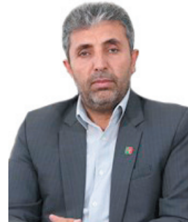
مدیرکل راهداری و حمل و نقل جاده‌های چهارمحال و بختیاری افتتاح ۱۰ پروژه در حوزه راهداری در چهارمحال و بختیاری