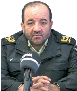
فرمانده انتظامی چهارمحال و بختیاری متهم به کلاهبرداری هفت میلیارد ریالی فروش خودرو در چهارمحال و بختیاری دستگیر شد