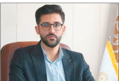
تجهیزات و تعمیرات کتابخانه مولوی شهرکرد انجام شده است.