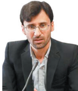
مدیرکل کتابخانه‌های عمومی چهارمحال و بختیاری: فضای کتابخانه‌های چهارمحال و بختیاری در دولت سیزدهم به ۳۵ هزار مترمربع رسید