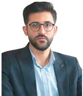
مدیرکل کار، تعاون و رفاه اجتماعی: ایجاد بیش از ۱۸ هزار فرصت شغلی در چهارمحال و بختیاری