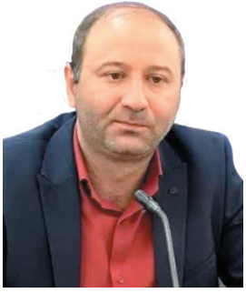
شهردار شهرکرد: استقبال مردم شهرکرد از ناوگان حمل و نقل عمومی کمتر از ۳۰ درصد است