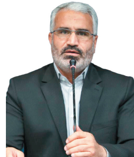
رئیس ستاد چهارمحال و بختیاری: شرکت در انتخابات یک حق است