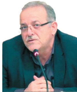
مدیرعامل اب منطقه‌های چهارمحال و بختیاری پارسی‌های اخیر چهارمحال و بختیاری تأثیر به نسبت متناسبی داشته است