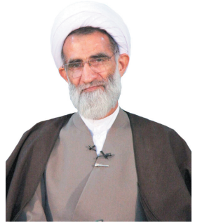
امام جمعه شهر کرد از حضور مردم چهارمحال و بختیاری در انتخابات قدردانی کرد