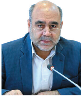
رئیس کل دادگستری چهارمحال و بختیاری: انتخابات استان در نهایت آرامش، سلامت و قانونمداری برگزار شد