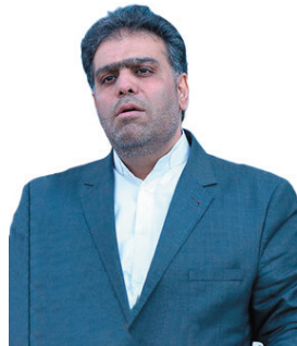
مدیرکل کمیته امداد امام خمینی (ره) چهارمحال و بختیاری توزع پنج هزار بسته معیشتی بین مددجویان کمیته امداد چهارمحال و بختیاری