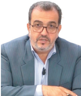
مدیرکل منابع طبیعی و آبخیزداری چهارمحال و بختیاری ۲ میلیون اصله نهال در یک سال اخیر در چهارمحال و بختیاری کشت شد