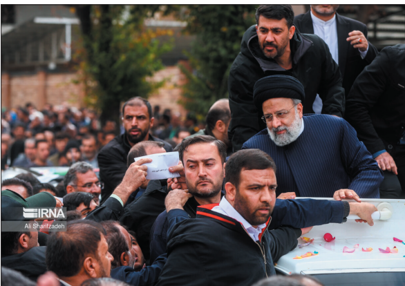
مدیرکل دفتر بازرسی استانداری چهارمحال و بختیاری اعلام کرد: براساس دستورالعمل، تمام نامه‌های مردمی مربوط به سفر دوم رییس جمهور به این استان در موعد مقرر از سوی دفتر بازرسی

تعددی با مدیران بانک‌های عامل برگزار شد که امید می‌رود پس از پالایش متقاضیان در سامانه رفاه ایرانیان، وام ۲۵۰ میلیون ریالی به متقاضیان واجد شرایط پرداخت شود. وی با بیان اینکه بعضی از نامه‌های ارسال شده قابلیت پاسخگویی ندارد و درخواست‌ها باید جنبه قانونی داشته باشد، اظهار داشت: اگر درخواستی غیرقانونی باشد چه تحت عنوان نامه تقدیمی به رییس جمهور و چه در میز خدمت، قابلیت اجرا نخواهد داشت و مشاوره لازم به متقاضی ارائه می‌شود. مدیرکل بازرسی استانداری چهارمحال و بختیاری با اشاره به حجم بالای نامه‌های تقدیمی در سفر دوم رییس جمهور به چهارمحال و بختیاری گفت: با وجود مشکلات عدیده استان در زمینه امکانات و نیروی انسانی متخصص، به خود می‌بایم که ۱۶۸ هزار نامه از سوی