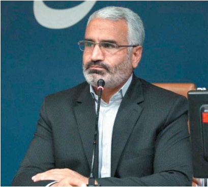
معاون سیاسی، امنیتی و اجتماعی استاندار چهارمحال و بختیاری گفت: با توجه به اینکه اسماال عید نوروز و ماه رمضان همزمان شده است اسکان

وی بهره‌گیری از ظرفیت اولیا و مربیان را نیز مورد تأکید قرار داد و گفت: نیاز امروز جامعه به