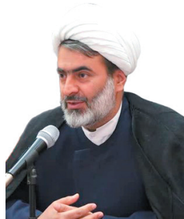
مدیرکل سازمان تبلیغات اسلامی چهارمحال و بختیاری: تشکیل شورای توسعه فعالیت‌های قرآنی در حال پیگیری است