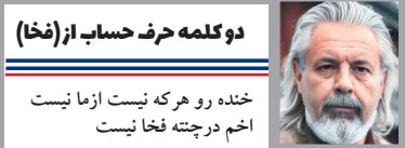
دو کلمه حرف حساب از (فخا)

خنده رو هر که نیست ازما نیست اخم در چرتنه فخا نیست