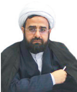
مدیرکل آوقاف چهارمحال و بختیاری: اجرای طرح آرامش بهاری در ۳۰ بقعه مشیرکه شاخص چهارمحال و بختیاری