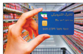
(بهمن) ۸۷ درصد، ماه دوم (اسفند) ۷۵ درصد استقبال از طرح فجرانه انجام شد.

وی با بیان اینکه ۷ دهک مشمول کالبرگ فجرانه هستند، گفت: برای هر نفر ۲۲۰ هزار تومان منابع شسارژ شده است. مشاور وزیر رفاه و توسعه اجتماعی و رفاه اجتماعی گفت: در ماه اول