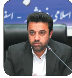
شهردار فرخنده راه‌اندازی کارخانه پسماند در شهر کرد باید تسریع شود