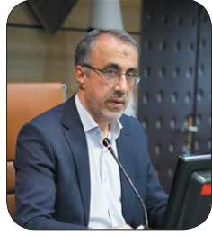
مدیرکل دفتر امور اجتماعی و فرهنگی استانداری تست‌نامه ملی نهفت مشارکت اجتماعی در چهارمحال و بختیاری آغاز شد