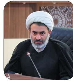
مدیرکل تبلیغات اسلامی چهارمحال و بختیاری: هدف اساسی طرح زندگی بسا آینه‌ها وارد کردن قرآن به زندگی مردم است