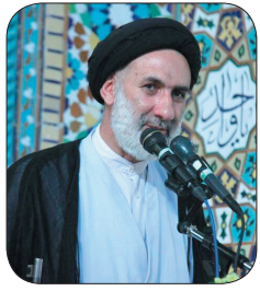
امام جمعه وقت شهر کرد: پیروی از ولایت فقیه رمز استواری ایران اسلامی است