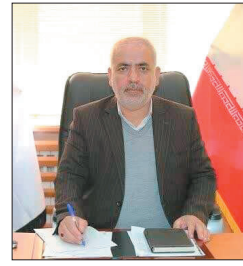
مدیرکل راه و شهرداری چهارمحال و بختیاری: اجازه خرید، فروش و واگذاری مسکن در طرح نهضت ملی وجود ندارد