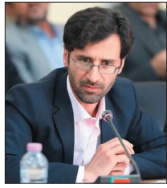
مدیرکل تعاون، کار و رفاه اجتماعی چهارمحال و بختیاری: طرح سرمایه‌گذاری وزارت تعاون در لاران اجرا می‌شود