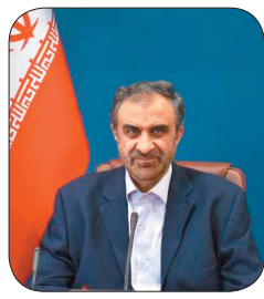
استادار چهارمحال و بختیاری، سپاه پاسداران سبلی محکمی به رژیم صهیونیستی زد