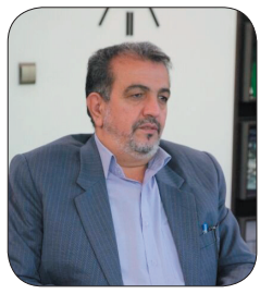
مدیرکل منابع طبیعی و اینخیزداری چهارمحال و بختیاری، نفو قرق، حفاظت از لاله‌های واگون را دستور می‌کند