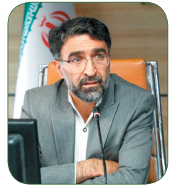
مدیر کل بنیاد شهید و امور ایثارگران چهارمحال و بختیاری، ۶۸ کلزار شهیدا در چهارمحال و بختیاری هنوز ساماندهی نشده است