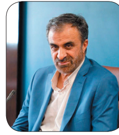
استاندار چهارمحال و بختیاری: ۱۵ هزار میلیارد ریال تجهیزات حوزه سلامت وارد چهارمحال و بختیاری شد