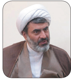
مدیرکل تبلیغات اسلامی چهارمحال و بختیاری: سپاه پاسداران یکی از عوامل جدی فرور و عزت ملی است